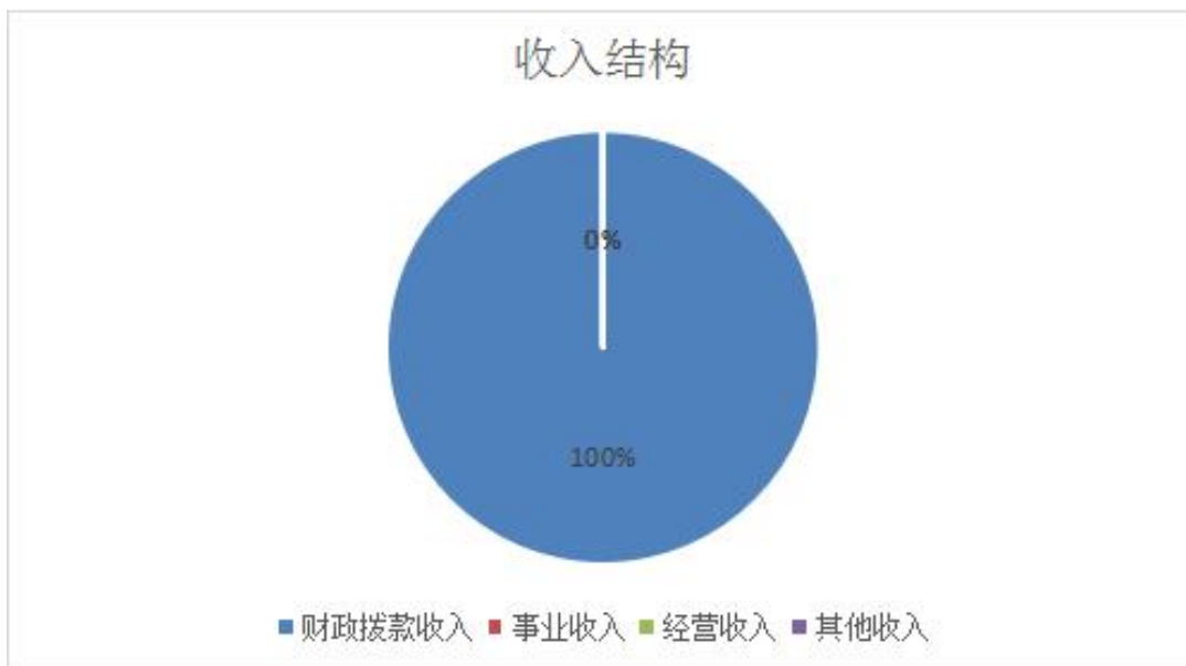
图1.收入决算图（以饼图列示）